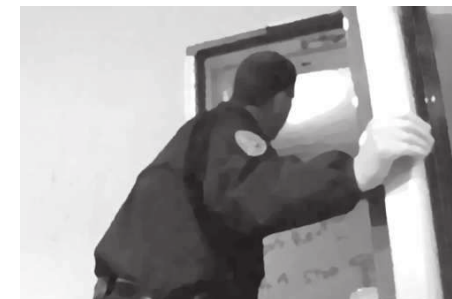
« Coronavirus : première nuit de couvre-feu à Poitiers » du 25/03/2020 sur France 3 Nouvelle-Aquitaine https://france3-regions.francetvinfo.fr/nouvelle-aquitaine/vienne/poitiers/coronavirus-premiere-nuit-couvre-feu-poitiers-1806094.html